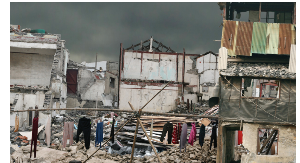
Zenchen Liu, Under Construction , 2008