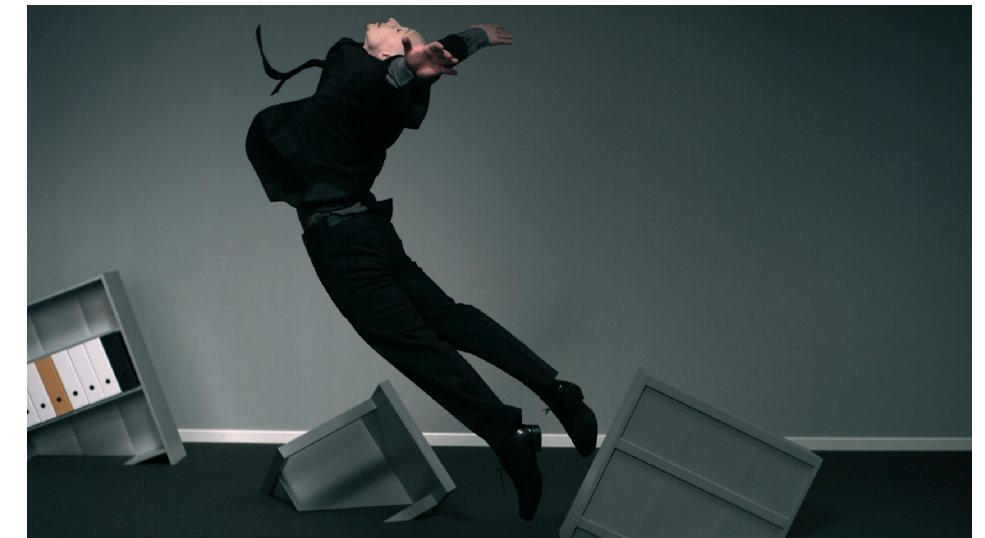
Clorinde Durand, Naufrage , 2008