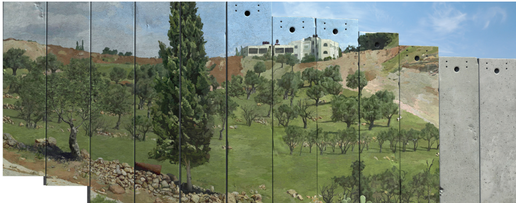
Laurent Mareschal, Ligne verte , 2005